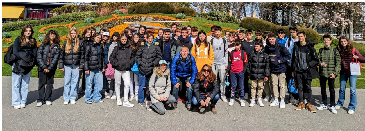
31è Intercanvi amb La Salle Pringy — La Salle Figueres. Març 2023 (Estada a Pringy)