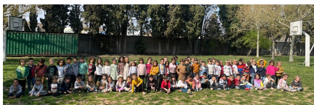
Jornada de convivència amb els alumnes de 5è de Primària i INF5 de La Salle de Perpinyà (Jornada a La Salle Figueres)