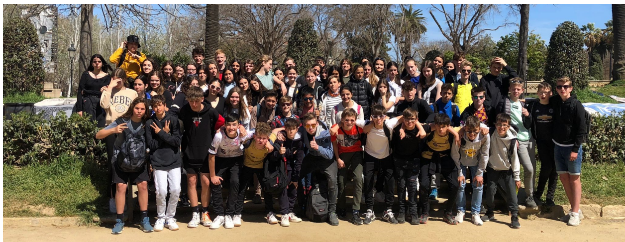
1r Intercanvi amb Països Baixos— La Salle Figueres. Març 2023 (Estada a Figueres)