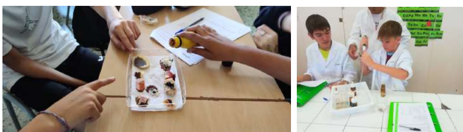
Moments d'experimentació i aprenentatges a Educació Secundària.