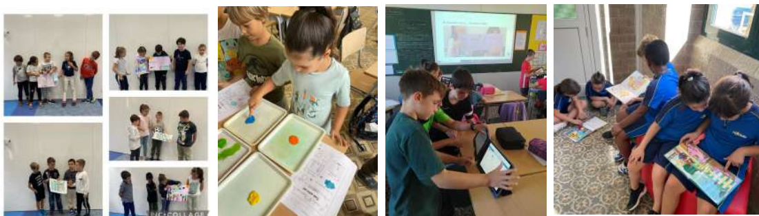
Moments d'experimentació i aprenentatges a Educació Primària.