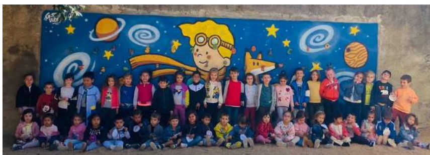
Els nens i nenes de INF5 donen la benvinguda als nens i nenes de INF3. Benvingudes i benvinguts a l'escola!

A més a més, aquest curs, als grups de Sallenet podeu trobar més imatges compartides del que fem a l'escola.