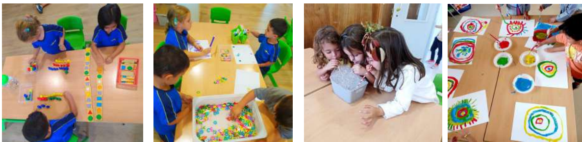
Moments d'experimentació i aprenentatges a Educació Infantil.